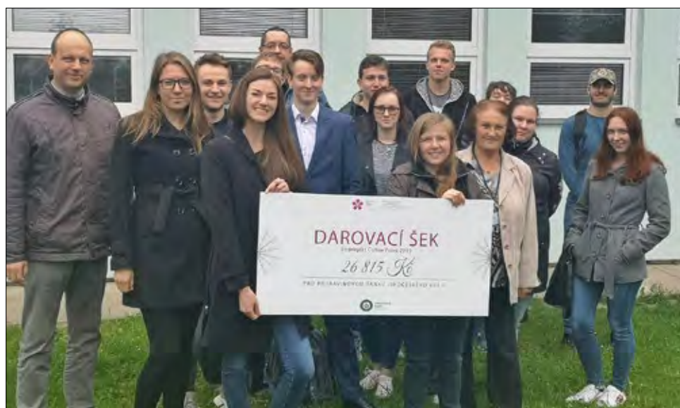
POTRAVINOVA BANKA - Ekonomická Fakulta Jihočeské univerzity, kteří pro jihočeskou potravinovou banku vynikající kávou vyvařili 26.815 korun. -fb-