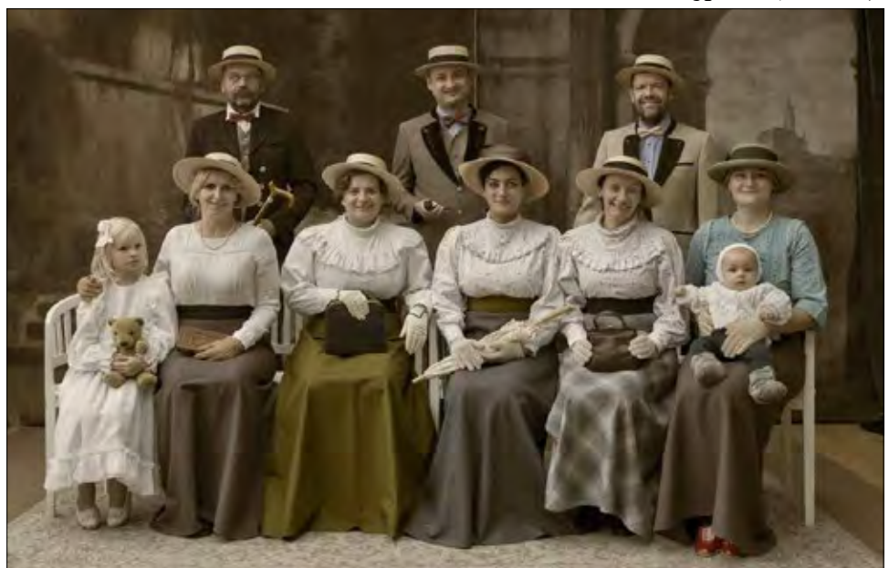
Společná fotografie zástupců CPDM, ZPCEM SK a AICM v Museu Fotoateliér Seidel Český Krumlov