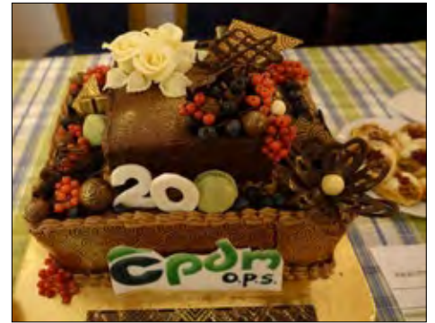
Narozeninový „sedmikilový“ dort k 20-ti letům CPDM (dar od ZPCEM)