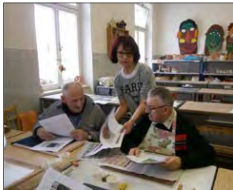
Březnové keramické tvoření...