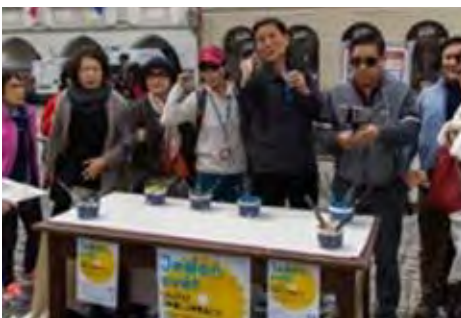
Happening na náměstí Svornosti.

Více na webových stránkách https://www.jedensvet.cz/2017/cesky-krumlov https://www.cpdm.cz -red-