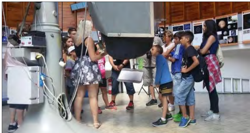
Hvězdárna na Kletí.

Děti si vyzkoušely například splutí řeky Vltavy z Českého Krumlova do Zlaté Koruny a podnikly výšlap na horu Klet, kde absolvovaly návštěvu hvězdárny.