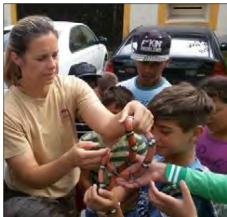
Návštěva v ZOO...

Děti si vyzkoušely například splutí řeky Vltavy z Českého Krumlova do Zlaté Koruny a podnikly výšlap na horu Klet, kde absolvovaly návštěvu hvězdárny.