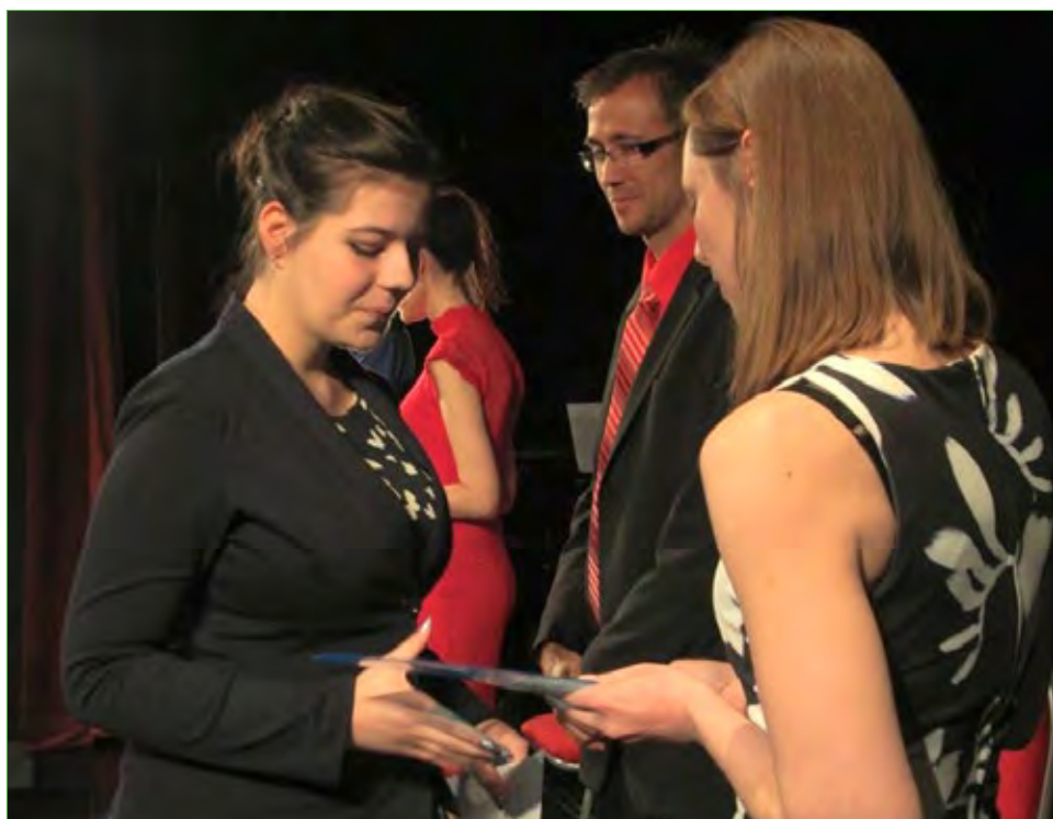
Slavnostní předávání maturitního vysvědčení...

Žižkova třída 4, České Budějovice, 370 01, telefon: 386 116 819, 724 757 613, email: stredniskola@stredniskola.cz , www.stredniskola.cz